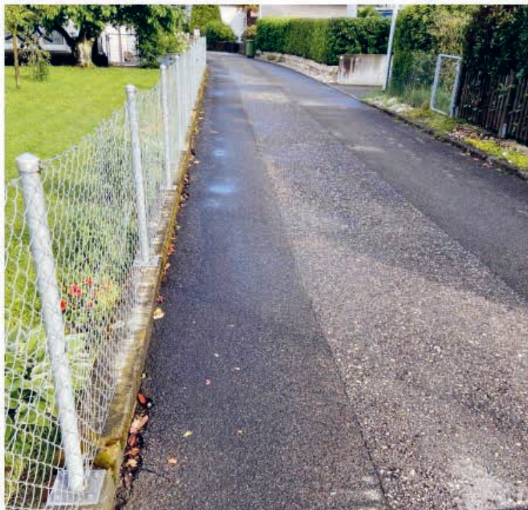
Abbildung 1: IST-Zustand Foto Birkenweg (12.06.2024)

Die Ingenieurbüro Senn AG wurde für die Erarbeitung des Bauprojekts «Strassen- und Werkleitungssanierung Hölzliquartier» durch den Gemeinderat Untersiggenthal beauftragt. Der umfassende Bericht liegt vor und ist während der Aktenaufgabe für die Gemeindeversammlung öffentlich einsehbar (oder auch via Internet auf unserer Homepage www.untersiggenthal.ch ).