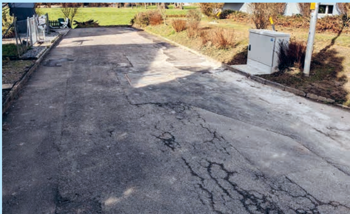
Zustand Birkenweg 2024 (Werkleitungs- und Strassensanierung «Hölzli»)

Donnerstag, 21. November 2024, 19.30 Uhr SICKINGA-Festsaal